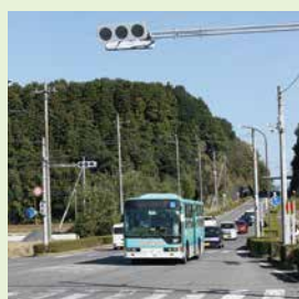
運行後は営業所に戻ります